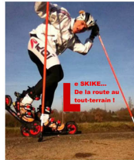
« le SKIKE... De la route au tout-terrain ! »