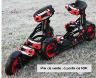
Prix de vente : à partir de 169€